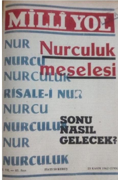
Milli Yol Dergisi 43. Sayı Kapağı