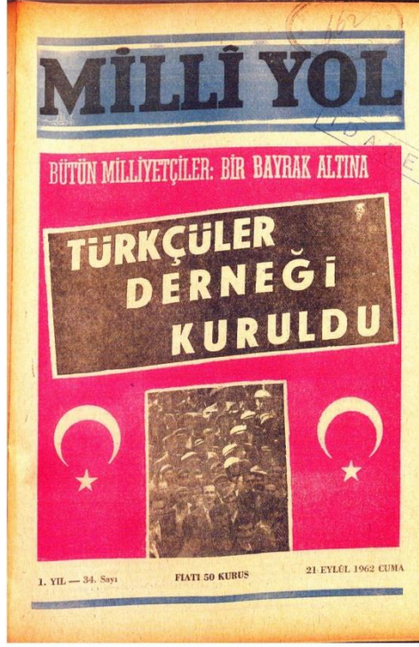
Milli Yol Dergisi 34. Sayısı Kapağı